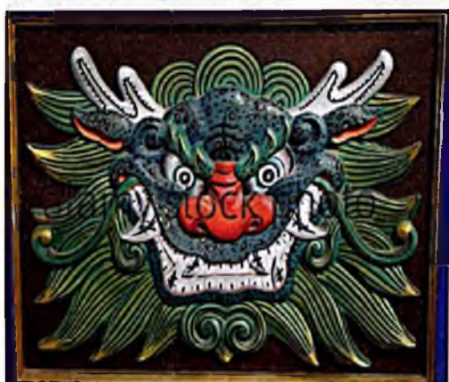
/4-р зураг/ Үлгэр домгийн амьтны баг ( Monster mask )

Энэтхэгийн Шивагийн эсвэл Буддын сүм хийд нь хорссон сүнсийг үргээх хөөх олон баг байдаг ба эдгээрийн ихэнх нь гадаад төрхөөрөө Солонгосын сүмийн үлгэр домгийн амьтны багтай төстэй юм. Арслан царайт Kirttimukha баг нь санскрит хэлнээ Алдар нэрийн баг гэгддэг. Шивагийн уур хилэнг илэрхийлэн төсөөлсөн төдийгүй үнэнч шудрага байдлыг хамгаалагч гэгдэнэ. Арслан царайт баг ба