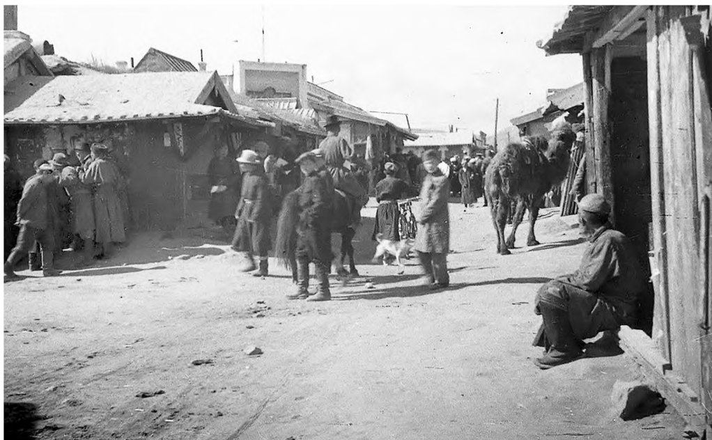
Зураг 1. Баруун дамнуурчин буюу 9 гудамж

"Анх Их Хүрээ 1778 онд одоогийн Сэлбэ голын эрэгт нүүдэллэн ирэхэд Маймаа хотын дэвсгэр дээр 12 майхантай хятад худалдаачин ирж суурилан, мөн хятад худалдаачдаас 72 хятад хүн бараа таваар дамнаж Хүрээнд авчран худалдаа наймаа хийдэг байсан учир баруун, зүүн дамнуурчныг Манжийн үед Хүрээний 72 дамнуурчин пүүс" 1 гэж нэрлэсэн ажээ. "Хятадын харьяат ба худалдаачны суух есөн гудамж буюу баруун, зүүн дамнуурчин, Маймаа хот хэмээгч бол мөн манж, хятадын хөрөнгөтөн худалдаачин" 2 ... суурьшсан газар байжээ. /Зураг 1/