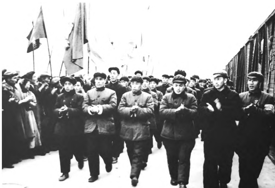
Зураг 3. Хятад ажилчдын эхний ээлж. 1955 он

1955 оны 5 дугаар сард БНХАУ-аас БНМАУ-д туслах анхны 6000 ажилчин ирсэн 15 үеэс эхлэн хятад ажилчид ээлж ээлжээр ирж байсантай холбогдуулан тэдний эрх ашгийг хамгаалах, соёл боловсрол олгох ажлыг идэвхтэй явуулах шаардлага зайлшгүй гарч байсан ажээ. /Зураг 3/